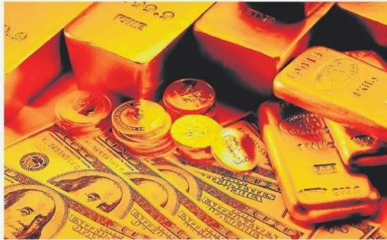
SYARIKAT-SYARIKAT pelaburan emas dan barangan logam bernilai kini melancarkan pelbagai taktik bertujuan menarik pelaburan daripada orang ramai dengan menjanjikan pulangan lumayan.

BNM dalam satu kenyataan di sini hari ini menyatakan bank pusat itu tidak mengeluarkan sebarang ke-