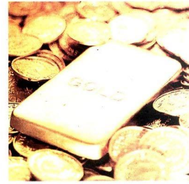
Pelaburan emas turut menjadi medium menipu orang ramai.

* Sumber laman web rasmi Bank Negara Malaysia