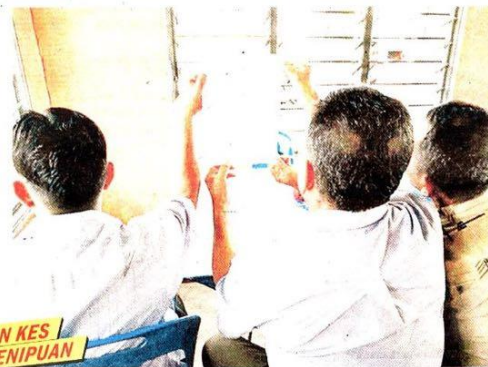
Mangsa menunjukkan laporan polis yang dibuat pada 13 Januari lalu.

mereka menerima SMS daripada pihak penganjur memaklumkan mereka telah menerima dividen itu.