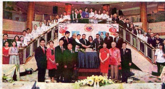
TUANKU Syed Faizuddin dan Tuanku Hajah Lalatul Shahreen memotong kek sempena sambutan ulang tahun pertama PUCM di Menara Berkembar Petronas.

land itu termasuk dalam sektor logistik, tenaga hijau, pemrosesan hijau dan pengurusan sisa.