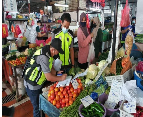
SSM NEGERI SEMBILAN